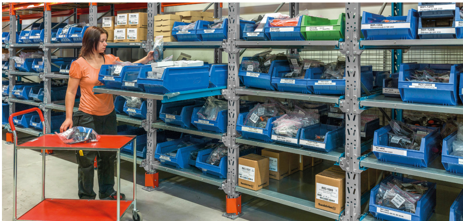
Utdragsplan för plockgoods utan pall