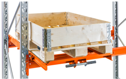
Utdragsenhet monterad på bärbalk