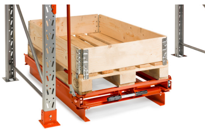
Förhöjningssats för stödbenstruck