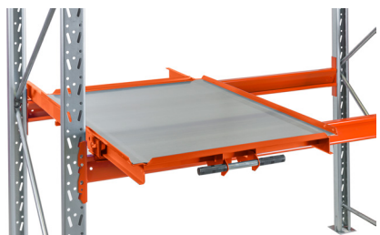
lläggspått för plockgoods utan pall