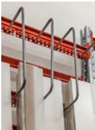
Avdelarbåge (925x500 mm) med fäste