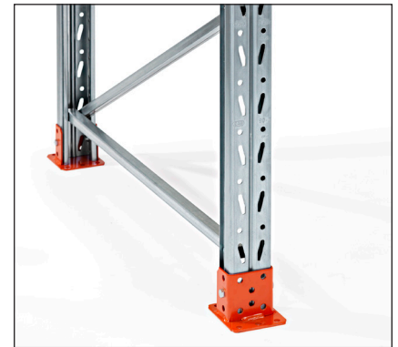
Suojia-aluslevy - suojaa pylvään alinta osaa ja samalla kunnan kiinnitys lattiaan.