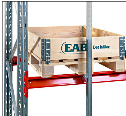
Lavarajoitin pysty - estää lavan sijoittamisen liian pitkälle.