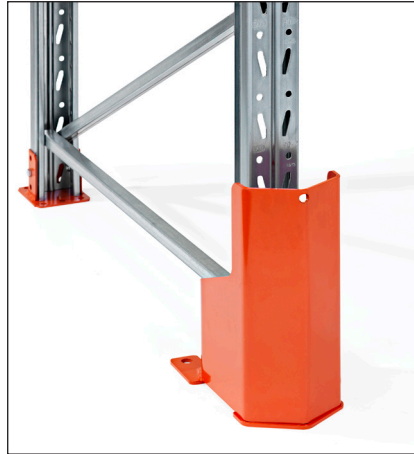
Pylväänsuoja 400 mm PU-jousella - asennetaan betonilattiaan. Parantaa suojan törmäskestävyyttä.