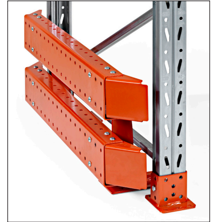
Törmäyssuoja 400 mm - päätyjen suojaamiseen törmäyksiltä. Saatavana 1 ja 2-puoleisiin hyllyihin.