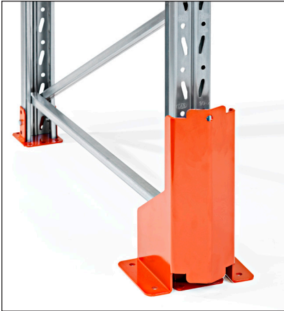
Pylväänsuoja 400 mm - asennetaan betonilattiaan.