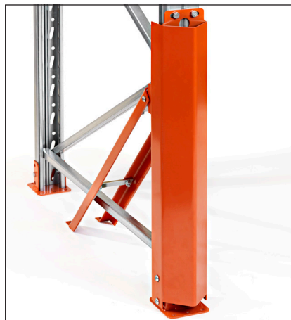
Pylväänvahvike 90 korkea - paras suoja pylvään herkimmille osille. Korkeus 760 mm.