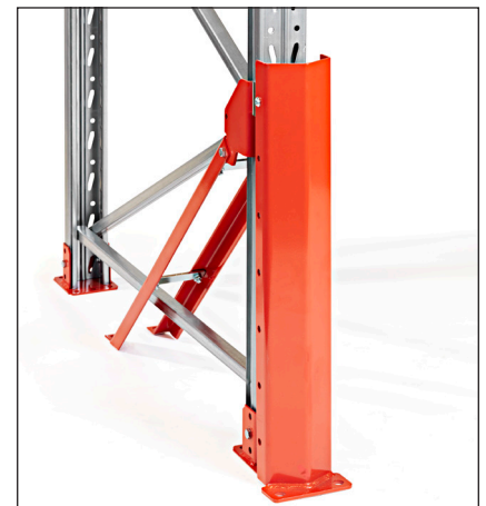
Pylväänvahvike 90 korkea etu - asennetaan pylvääseen ja lattiaan. Mahdollistaa vaakapalkin asentamisen alhaalle.