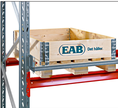
Lavarajoitin vaaka - estää lavan sijoittamisen liian pitkälle