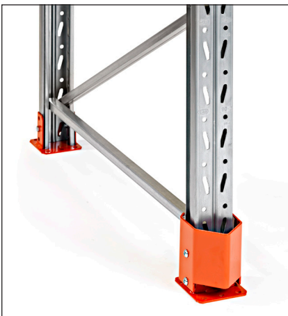
Pylväänvahvike 90 - yhdessä suojia-aluslevyn kanssa. Estää pylvään vaurioitumista ja vie vähän tilaa. Korkeus 150 mm.